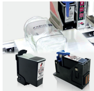
Thermal Inkjet WOCCS